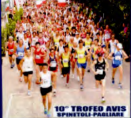
10° TROFEO AVIS SPINETOLI-PAGLIARE