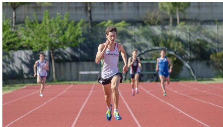
Simone Barontini sui 400 metri