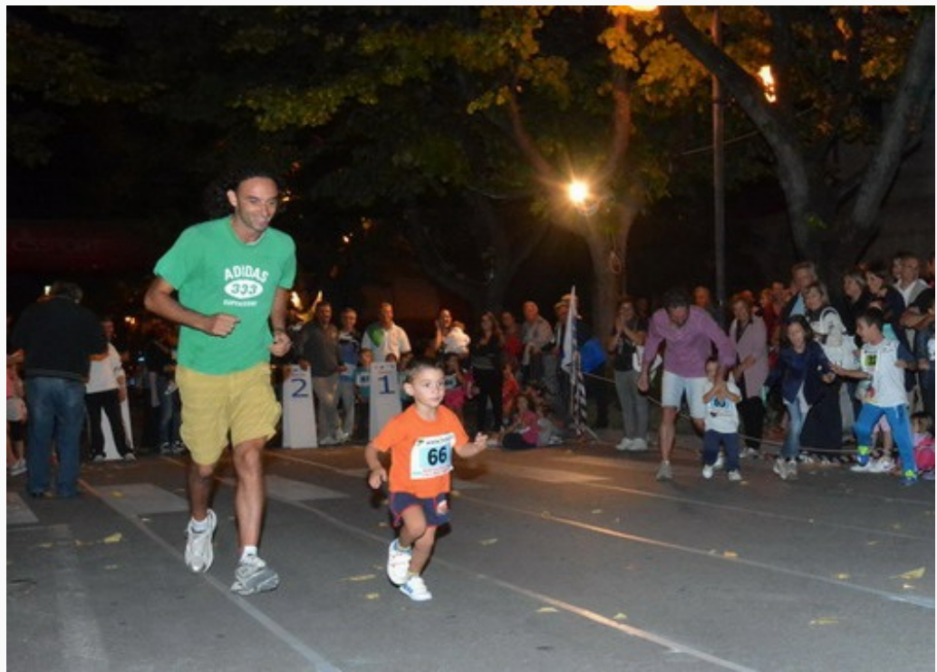
L'edizione 2013 per i ragazzi