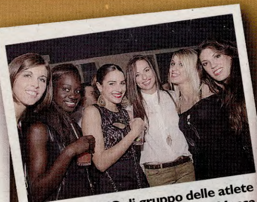
FOTO di gruppo delle atlete dell'Acqua Roana Mosca di Villa Potenza, serie B2.

BELLE ragazze alla nuova discoteca-club di Porto Recanati, il People che ha aperto da due domeniche. Unico riferimento per ballare la domenica.