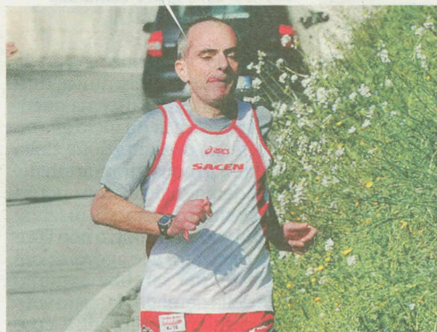
Quattro momenti della Podistica Pausulana organizzata dalla Sacen che si è svolta ieri a Corridonia e Petriolo