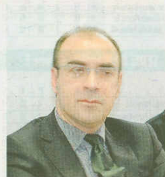
L'assessore Sandro Donati

San Benedetto Si è svolta a San Benedetto la seconda prova del primo campionato regionale di nuoto della federazione Paralimpica, e terzo campionato regionale della federazione Sport disabilità intellettiva e relazionale. Tra i presenti in tribuna c'era anche l'assessore regionale all'ambiente Sandro Donati. "Il pietismo - ha detto Donati - non fa per questi ragazzi, che non chiedono assistenzialismo e pacche sulle spalle, ma sono solo desiderosi di raggiungere traguardi con le proprie forze". In tutto sono state otto le prove (quattro per il settore promozione e altre